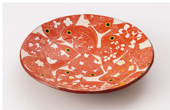
鯛づくし 大皿 (H6.5×Φ33.0cm)