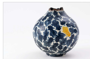
金魚づくし 壺 (H23.3×Φ22.5cm)