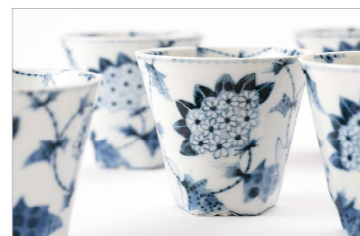
花唐草文 煎茶碗揃 (H7.4×Φ8.3cm)