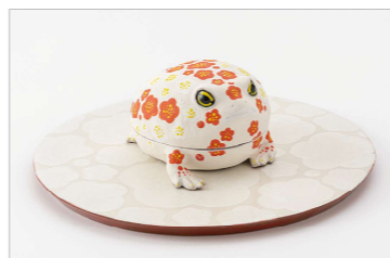
こぼれ梅 ふくら蛙 (H8.3×W11.3×D13.8cm)

個人的なことから、世界的なことまで、毎日とはまならないことであふれていて、じわじわとすり減るような、締め付けられるようなそんな感覚を誰でも感じることがあると思います。そんな毎日の中でも、近くにあるとフワッと気持ちがほぐれたり、ほっと肩の力が抜けるような、できればふふっと笑えるようなそんなものが作りたいと考えながら作陶しています。