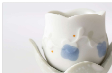
酒壺 壺台 石花(白) (H7.8×W7.0×D6.0cm)

2023年頃から取り組んでいた「雲語り」作品が中心となっております。植物や身のまわりの大切なものをモチーフに、刻々と変化する雲のかたちから模様を想像します。雲がそっと折り重なるように、器のアウトラインを掘り出し、かたちにしています。ご覧いただくと幸いです。