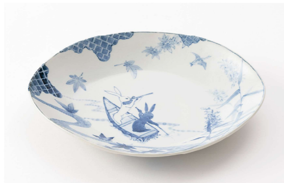
狩り文様 楕円皿 (H4.5×W26.3×D21.0cm)