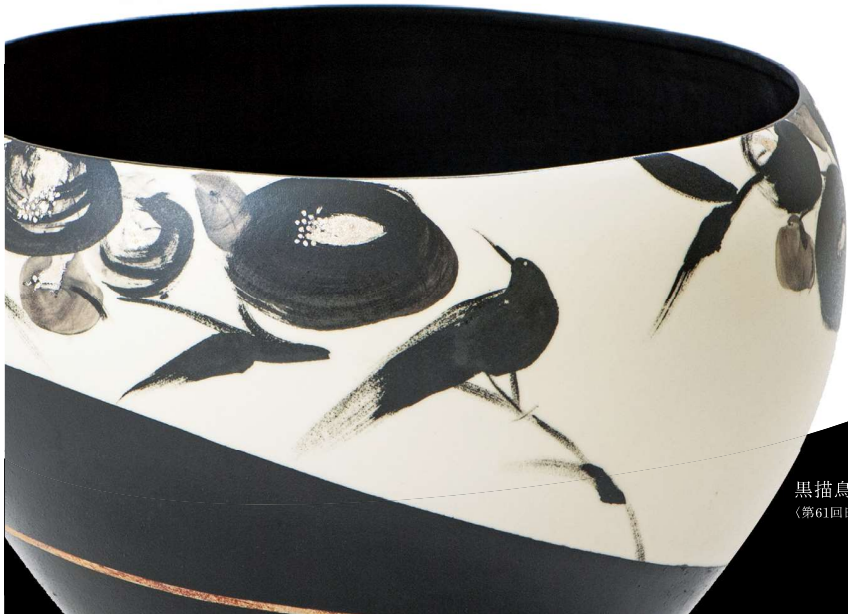
黒描鳥花文鉢 個人蔵 (第61回日本伝統工芸展 朝日新聞社賞受賞作品)