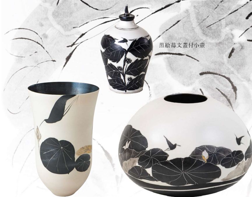
黒絵菫文蓋付小壺