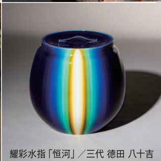
耀彩水指「恒河」 / 三代 徳田 八十吉