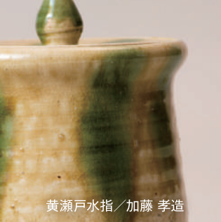
黄瀬戸水指 / 加藤 孝造