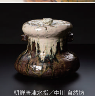
朝鮮唐津水指 / 中川 自然坊