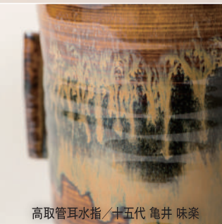
高取管耳水指 / 五代 亀井 味楽