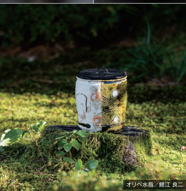
オリベ水指 / 鯉江 良二

茶席で湯を沸かす釜と対に置かれる水指は、湯相を整え、茶碗などを清めるための水を貯える器。四季折々の趣と調和し、主客が心を交わすための大切な茶道具です。時代ごとに多種多様な水指を取り合わせた茶人たちと、各地の窯で創意と技法を駆使して挑んできた作家たちによって発展しました。今回は緑ヶ丘美術館のコレクションから、近現代の名匠たちの作品を展示。焼きの景色、豊かな造形、釉の装飾、鮮やかな色彩。先人の技を受け継ぎ、独自の息吹を纏わせ、それぞれの美を宿した名品の数々。清浄なる水器に心を澄ます悠久の時を味わいながら、時代が変われども魂に響き続ける「もてなしの美」をご高覧ください。