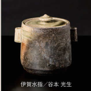
伊賀水指 / 谷本 光生