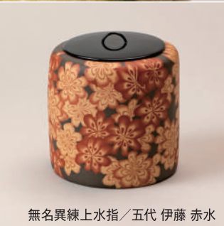
無名異練上水指 / 五代 伊藤 赤水