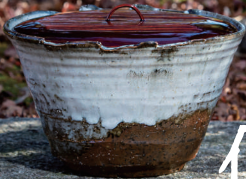
萩焼水指 / 渋谷 泥詩